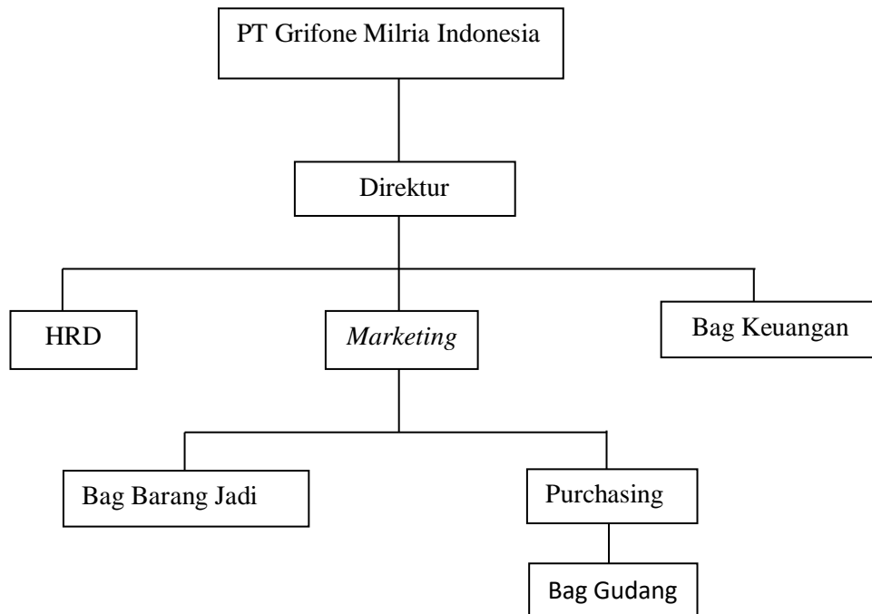
Gambar 4.1 Struktur Organisasi